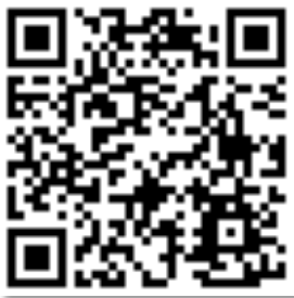
Certificato Travel Appeal